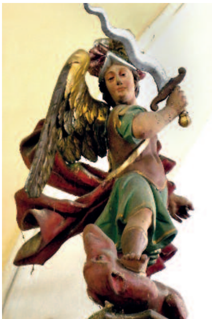
Barokní socha svatého Michaela na kazatelně v Blatenském kostele

Pouť souvisí se slovem putovat. Jaký ale měli lidé v minulosti důvod k putování? Cestování na větší vzdálenost bylo pomalé, nepohodlné a pokud si někdo chtěl cestování zpříjemnit, pak bylo i drahé. Běžným důvodem k delší cestě byl významný svátek v některé z okolních obcí. Kromě svátků státních – Vánoce, Velikonoce, svátky apoštolů atd. (církvní svátek byl současně svátkem státním), mohla mít obec navíc ještě dva svátky vlastní. Prvním z nich byl svátek patrona místního kostela – lidově zvaný Pouť, druhým bylo výročí posvěcení místního kostela – lidově zvané Posvěcení (někde se obojí slavilo v jeden den). Obec, která neměla kostel (nebo alespoň kapli), pochopitelně tyto svátky mít nemohla. Na pouť i posvěcení se obce připravovaly velmi svědomitě. Uklízelo se, zdobilo, vařilo a peklo. Přípravy byly podobného rozsahu, jako například v dnešní době před Vánocemi. Ústředním bodem obou svátků byla slavná mše v místním kostele, na kterou se sešli lidé z širokého okolí. Zvýšená koncentrace lidí přilákala různé stánkaře, divadelníky, provozovatele atrakcí a jiné živnostníky, kteří mohli při té příležitosti něco vydělat.