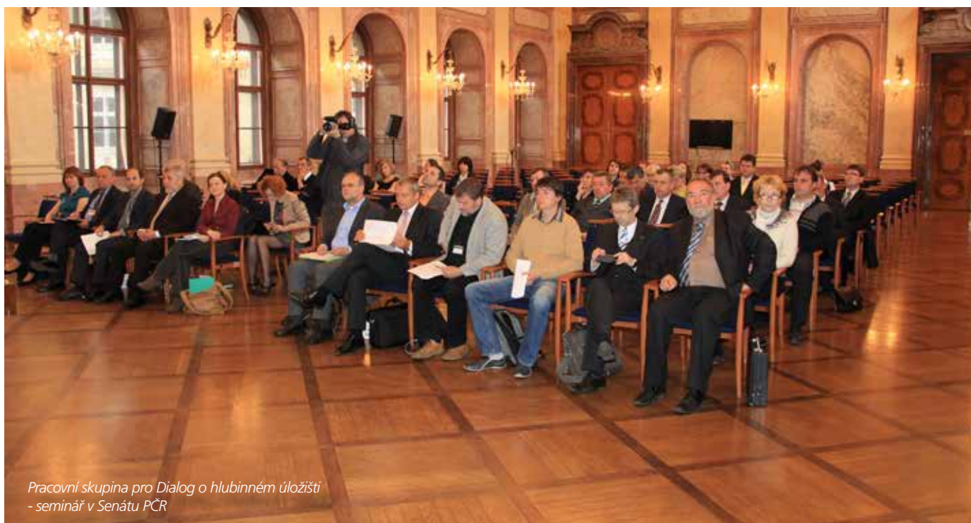
Pracovní skupina pro Dialog o hlubinném úložišti - seminář v Senátu PČR

Jak tomu jednou bude na finální lokalitě budoucího hlubinného úložiště je jen a jen na nás – státu, společně s dotčenými obcemi. Abychom dospěli ke konsensuálnímu řešení, je třeba aktivního přístupu jak ze strany státu, tak i ze strany obcí. Prvním krokem jistě bude transformovaná Pracovní skupina pro Dialog, dnes nově ustavená pod Radou Vlády pro surovinovou a energetickou strategii. Výsledky jednání tak budou podkladem pro rozhodování vlády. Měli bychom této příležitosti využít.