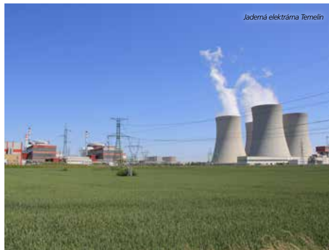
Jaderná elektrárna Temelín

Výstavbě hlubinného úložiště předcházejí desítky let velmi podrobných geologických průzkumů a dalších nejen environmentálních studií, samozřejmě včetně budoucí studie možných vlivů na životní prostředí (EIA). Smyslem hlubinného úložiště je izolace radioaktivních odpadů od všech složek životního prostředí dokud se radioaktivita nesníží na úroveň, která odpovídá látkám, vyskytujícím se v přírodě (např. uranová ruda). Časový horizont přeměny odpovídá desítkám až statisícům let. Dnes předběžně projektovaný areál však bude v provozu desítky let, zaměstná až stovky lidí